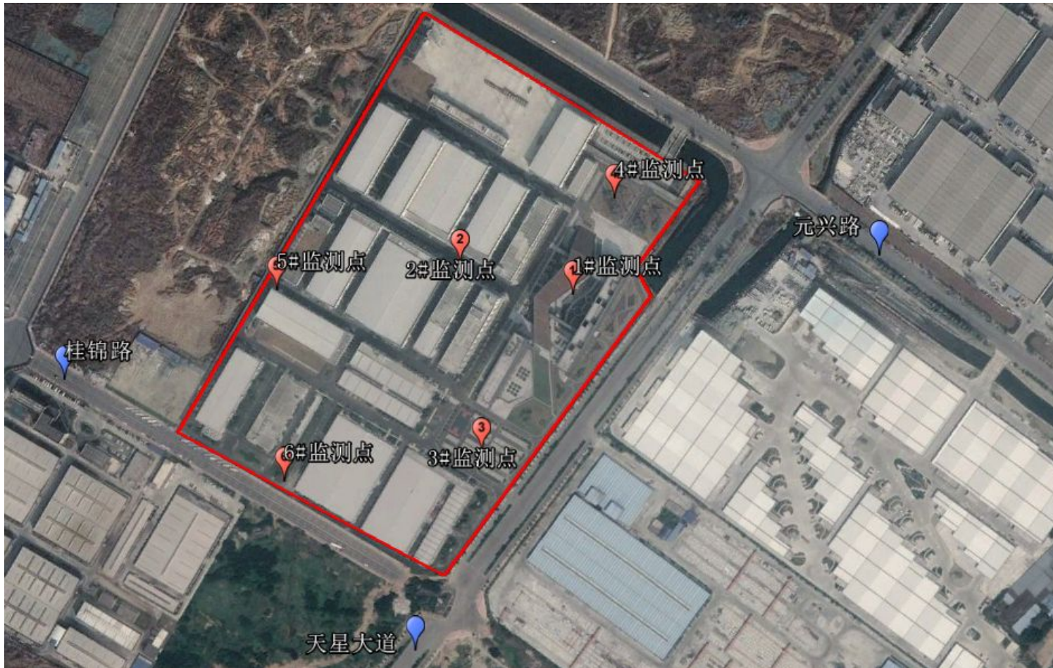
图 1-3 监测点位布设