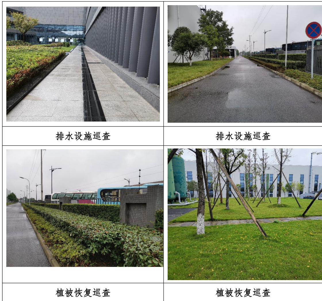
图 1-5 项目监测实施情况现状图