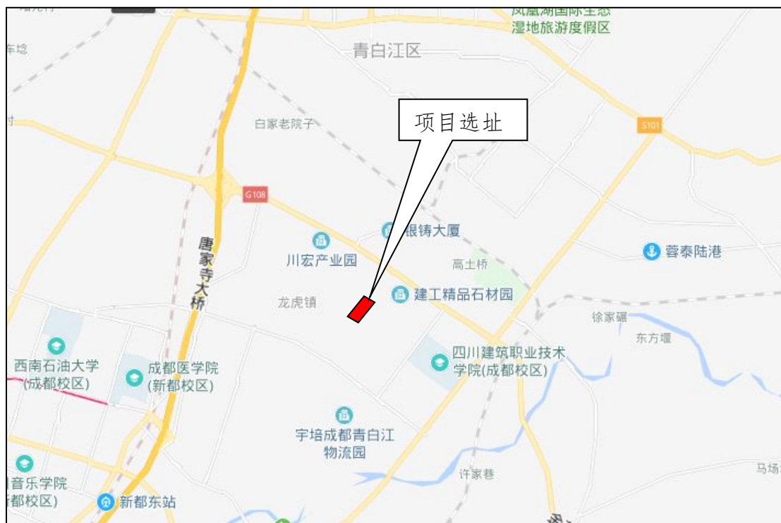
图 1-1 地理位置图

地块交通便利，地块南侧为桂锦路，北侧为元兴路，东侧为天星大道，西侧为无名道路。地块设置 2 个出入口，主入口位于东北侧元兴路，次入口位于西南侧桂锦路。