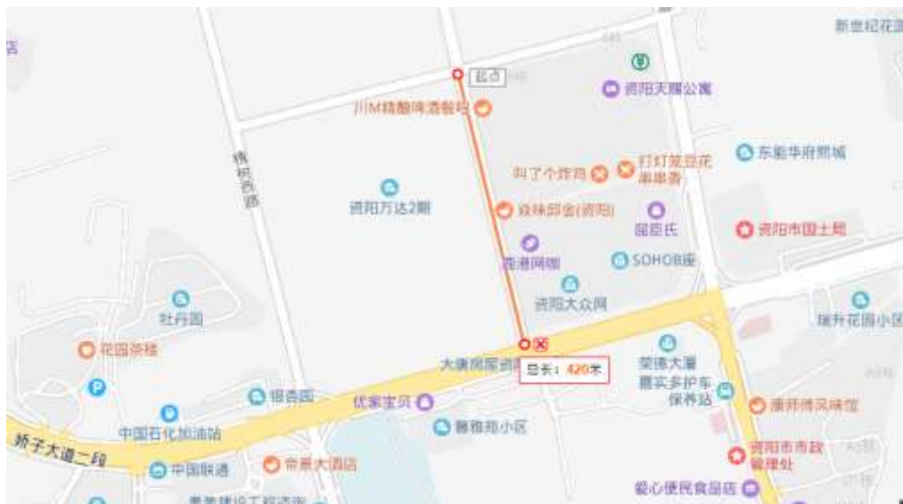
图 1-2 工程地理位置现状示意图