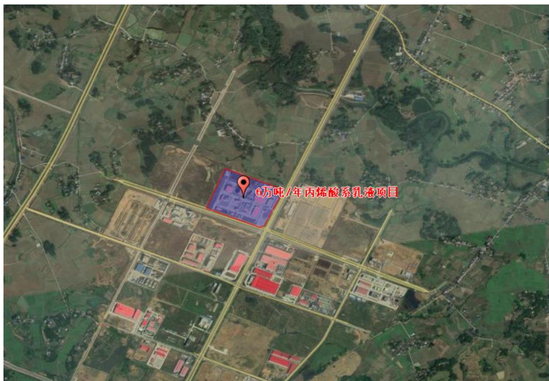
图 1.1 工程建设场址位置示意